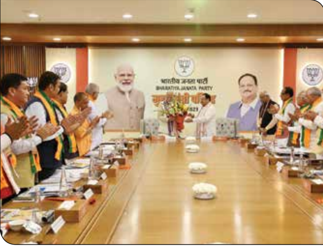
नई दिल्ली में 28 मई, 2023 को भाजपा मुख्यमंत्री परिषद् की बैठक में प्रधानमंत्री श्री नरेन्द्र मोदी का स्वागत करते भाजपा राष्ट्रीय अध्यक्ष श्री जगत प्रकाश नड्डा