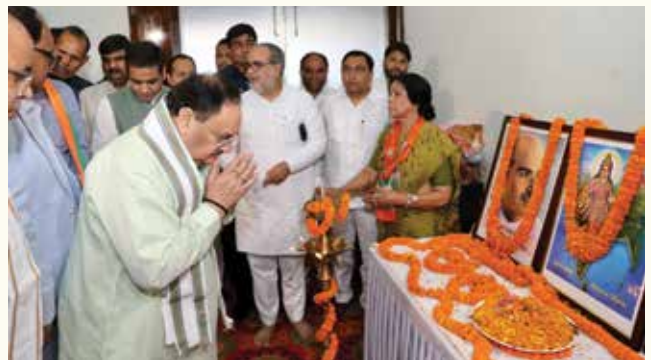
एलपीएस ग्लोबल स्कूल, डी-196/2, सेक्टर 51, नोएडा में 07 जून, 2023 को आयोजित 'टिफिन बैठक' के दौरान भाजपा राष्ट्रीय अध्यक्ष श्री जगत प्रकाश नड्डा