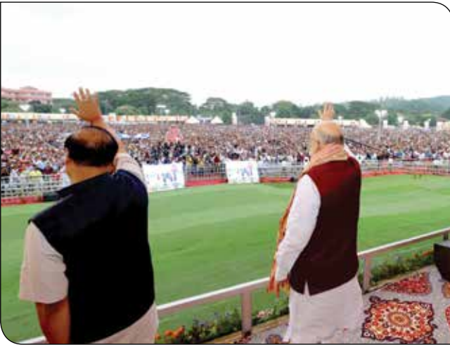
असम में 25 मई, 2023 को सफल उम्मीदवारों को 44,703 नियुक्ति पत्र वितरित करने के बाद एक विशाल रैली को संबोधित करते केंद्रीय गृह एवं सहकारिता मंत्री श्री अमित शाह