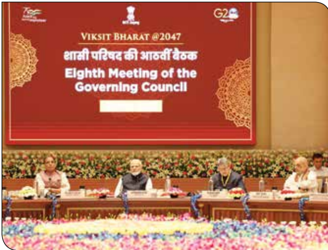
नई दिल्ली में 27 मई, 2023 को नीति आयोग की 8वीं गवर्निंग काउंसिल की बैठक की अध्यक्षता करते प्रधानमंत्री श्री नरेन्द्र मोदी