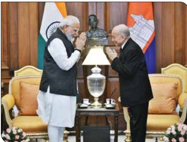
नई दिल्ली में 30 मई, 2023 को कंबोडिया के राजा श्री नोरोडोम सिहामोनी से मुलाकात करते प्रधानमंत्री श्री नरेन्द्र मोदी