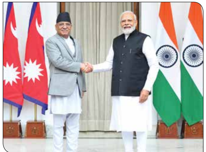
हैदराबाद हाउस (नई दिल्ली) में 01 जून, 2023 को नेपाल के प्रधानमंत्री श्री पुष्प कमल देहल के साथ बैठक के दौरान प्रधानमंत्री श्री नरेन्द्र मोदी