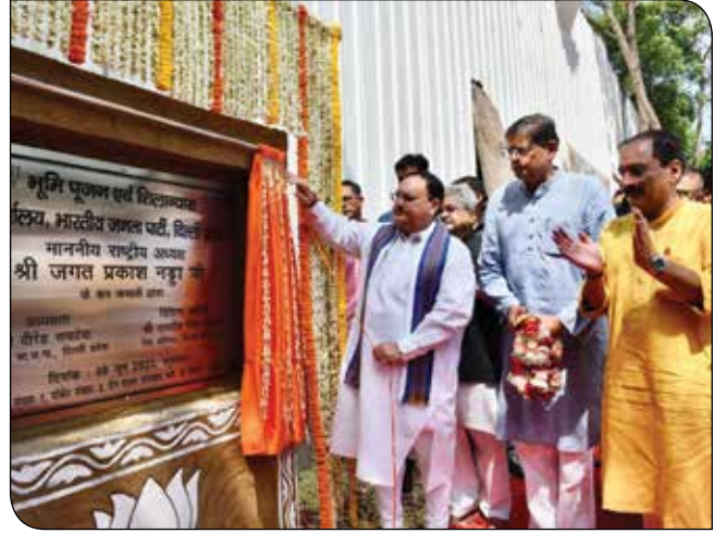
नई दिल्ली में 09 जून, 2023 को दिल्ली भाजपा प्रदेश कार्यालय का शिलान्यास करते भाजपा राष्ट्रीय अध्यक्ष श्री जगत प्रकाश नड्डा