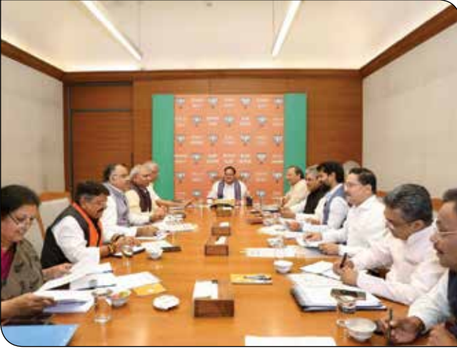
नई दिल्ली में 09 जून, 2023 को भाजपा राष्ट्रीय महामंत्रियों की बैठक की अध्यक्षता करते भाजपा राष्ट्रीय अध्यक्ष श्री जगत प्रकाश नड्डा