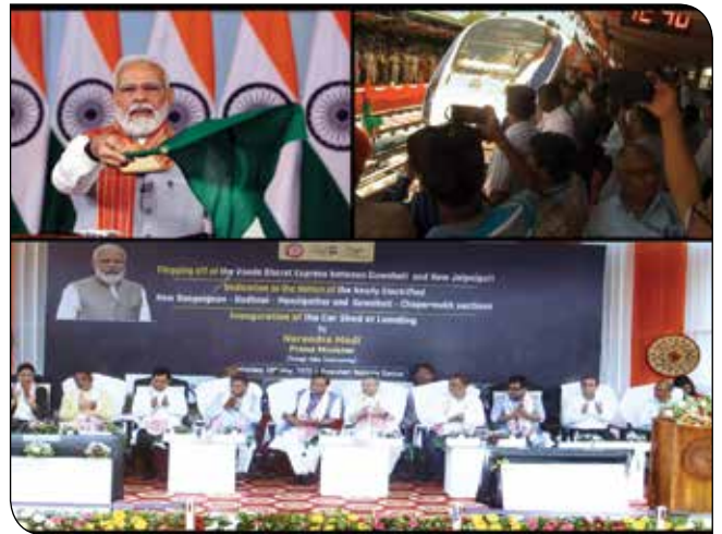
29 मई, 2023 को न्यू जलपाईगुड़ी और गुवाहाटी के बीच असम की पहली वंदे भारत एक्सप्रेस ट्रेन को हरी झंडी दिखाते प्रधानमंत्री श्री नरेन्द्र मोदी