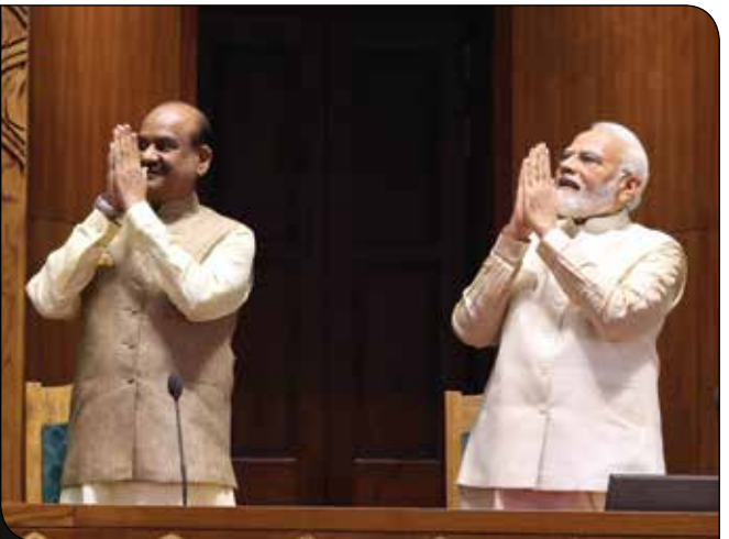
नई दिल्ली में 28 मई, 2023 को नए संसद भवन में अभिवादन स्वीकार करते प्रधानमंत्री श्री नरेन्द्र मोदी