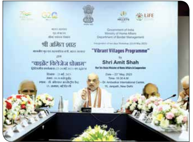
नई दिल्ली में 23 मई, 2023 को 'वाइब्रेंट विलेज प्रोग्राम' पर दो दिवसीय कार्यशाला का उद्घाटन करते केंद्रीय गृह और सहकारिता मंत्री श्री अमित शाह