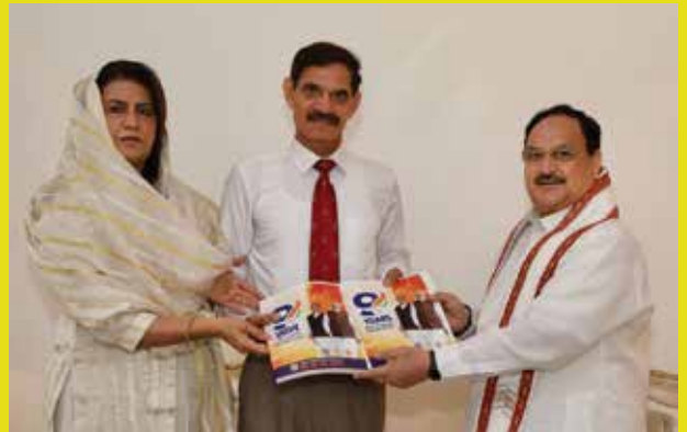
5 जून, 2023 को पूर्व सेनाध्यक्ष जनरल श्री दलवीर सिंह सुहाग से 38, डियरवुड निर्वाण कंट्री, सेक्टर 50, गुरुग्राम में भेंट करते भाजपा राष्ट्रीय अध्यक्ष श्री जगत प्रकाश नड्डा