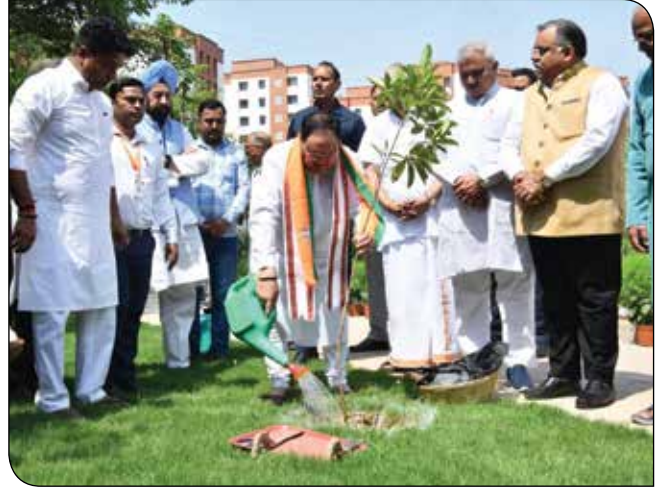
भाजपा मुख्यालय (नई दिल्ली) में 05 जून, 2023 को 'विश्व पर्यावरण दिवस' के अवसर पर पौधारोपण करते भाजपा राष्ट्रीय अध्यक्ष श्री जगत प्रकाश नड्डा