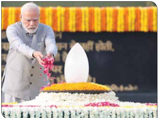
नई दिल्ली में 16 अगस्त, 2023 को 'सदैव अटल' जाकर भारत के पूर्व प्रधानमंत्री श्री अटल बिहारी वाजपेयी की पुण्यतिथि पर उन्हें पुष्पांजलि अर्पित करते प्रधानमंत्री श्री नरेन्द्र मोदी