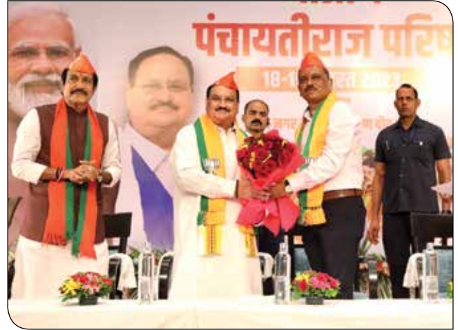
18 अगस्त, 2023 को क्षेत्रीय पंचायती राज सम्मेलन में भाजपा दादर नगर हवेली और दमन दीव द्वारा भाजपा राष्ट्रीय अध्यक्ष श्री जगत प्रकाश नड्डा का अभिनंदन किया गया