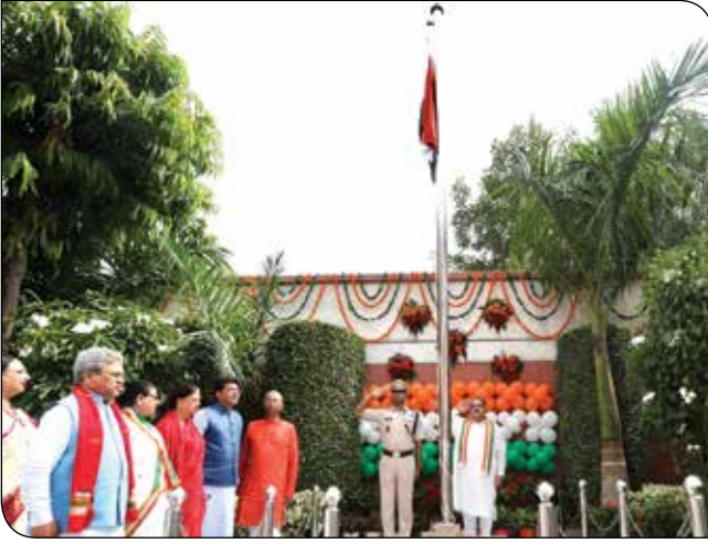
भाजपा मुख्यालय (नई दिल्ली) में 15 अगस्त, 2023 को 77वें स्वतंत्रता दिवस के अवसर पर राष्ट्रीय ध्वज फहराते भाजपा राष्ट्रीय अध्यक्ष श्री जगत प्रकाश नड्डा