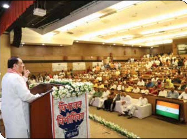
नई दिल्ली में 14 अगस्त, 2023 को 'विभाजन विधीषिका स्मृति दिवस' कार्यक्रम को संबोधित करते भाजपा राष्ट्रीय अध्यक्ष श्री जगत प्रकाश नड्डा