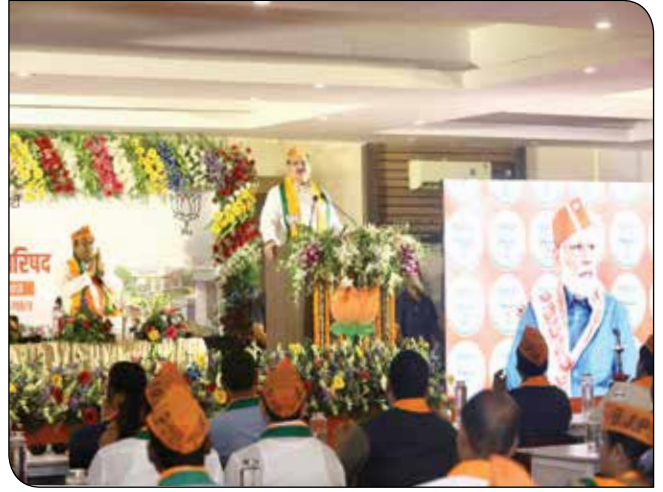
हावड़ा (कोलकाता) में 12 अगस्त, 2023 को क्षेत्रीय पंचायती राज परिषद् के उद्घाटन सत्र को संबोधित करते भाजपा राष्ट्रीय अध्यक्ष श्री जगत प्रकाश नड्डा