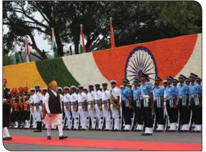
नई दिल्ली में 15 अगस्त, 2023 को 77वें स्वतंत्रता दिवस के अवसर पर लाल किला परिसर में गार्ड ऑफ ऑनर का निरीक्षण करते प्रधानमंत्री श्री नरेन्द्र मोदी