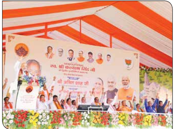
अलीगढ़ (उत्तर प्रदेश) में 21 अगस्त, 2023 को कल्याण सिंह जी की दूसरी पुण्यतिथि के अवसर पर 'हिंदू गौरव दिवस' को संबोधित करते केंद्रीय गृह एवं सहकारिता मंत्री श्री अमित शाह