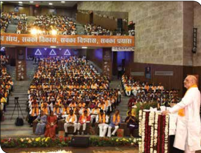
अटल बिहारी वाजपेयी सभागार (ग्वालियर) में 20 अगस्त, 2023 को मध्य प्रदेश वृहद कार्यसमिति की बैठक को संबोधित करते केंद्रीय गृह एवं सहकारिता मंत्री श्री अमित शाह