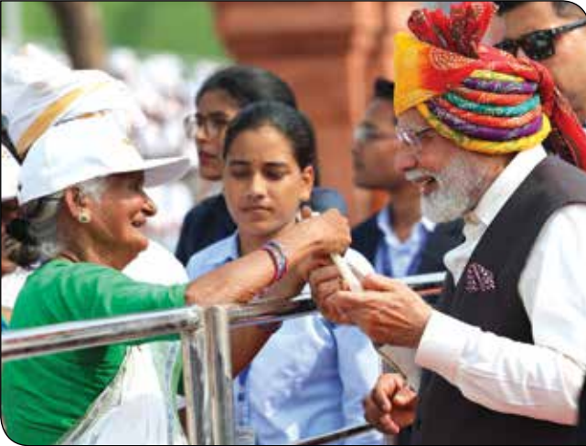
नई दिल्ली में 15 अगस्त, 2023 को लाल किला परिसर में स्वतंत्रता दिवस समारोह के प्रतिभागियों के साथ बातचीत करते प्रधानमंत्री श्री नरेन्द्र मोदी