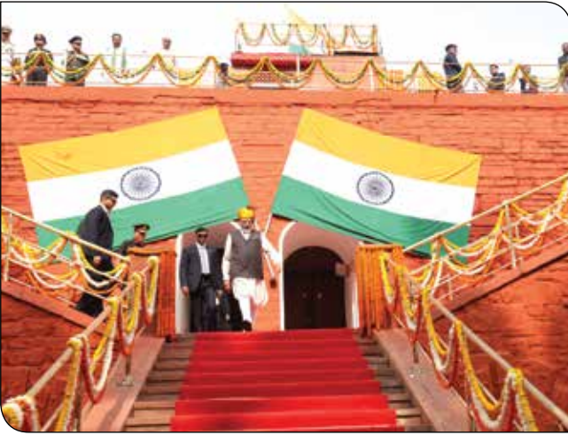
नई दिल्ली में 15 अगस्त, 2023 को 77वें स्वतंत्रता दिवस के अवसर पर राष्ट्र को संबोधित करने से ठीक पहले लाल किला परिसर में प्रधानमंत्री श्री नरेन्द्र मोदी