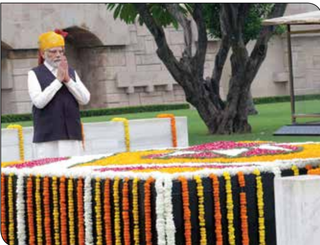
नई दिल्ली में 15 अगस्त, 2023 को 77वें स्वतंत्रता दिवस के अवसर पर राजघाट पर महात्मा गांधी की समाधि पर श्रद्धांजलि अर्पित करते प्रधानमंत्री श्री नरेन्द्र मोदी